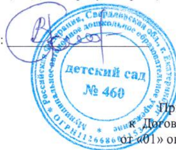
ГРАФИК ПОСТАВКИ ТОВАРОВ